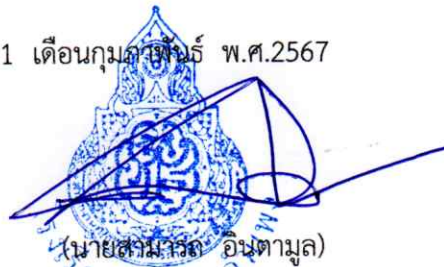
(นายสมภาร อ้นตามูล) ผู้อำนวยการโรงเรียนบ้านสันกำแพง

ประกาศ ณ วันที่ 21 เดือนกุมภาพันธ์ พ.ศ.2567